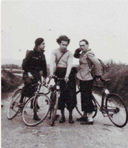
1939 - Sur la route des Cévennes