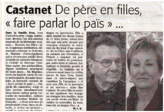
Faire parler lo país